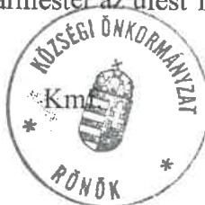
Pékó Tamás Lajos polgármester

Több napirendi pont nem volt, a polgármester az ülést 17 óra 10 perckor bezárta.