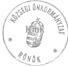
Pékó Tamás Lajos polgármester

Több napirendi pont nem volt, a polgármester az ülést 16 óra 55 perckor bezárta.