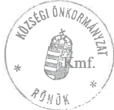
Pékó Tamás Lajos polgármester

Több napirendi pont nem volt, a polgármester az ülést 17 óra 40 perckor bezárta.