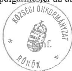
Pékó Tamás Lajos polgármester

Több napirendi pont nem volt, a polgármester az ülést 17 óra 35 perckor bezárta.